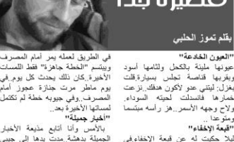
بقلم نورا الحادي

"العمون القاذبة" عونيها ملبنة بالكعل ولتامها أسود وبارديها قفاصة تجلس بسيرة قلفت بعزل: ليتني عمو لأكون هكلك ذاعت خارها فاستقلت لجنه السوداء ولاح وجهه الأسمر. هر راسه ممتسا ومتو عدا . "أفحة الإخفاء" أبلا حكمة له عن قبة الإخفاء في الصباح اعتمر قبة وساقني، أبي هل تراني قفت: لا في المساء قالت أمي: أنا جارا منصور امسك به يسوق البيض من يهور كعلته. وطي راسه قبة . "الشمسات الأخيرة" ساحل قافتي أني وقع المدي وصوت المكان وأجرحه خافتي على أنني الصواب مرة أخرى أنا لث من الغياب؟ أنا لث بعد حيات عبار على أفورة أنا لث من الغياب؟ أنا لث بعد حيات عبار على أفورة