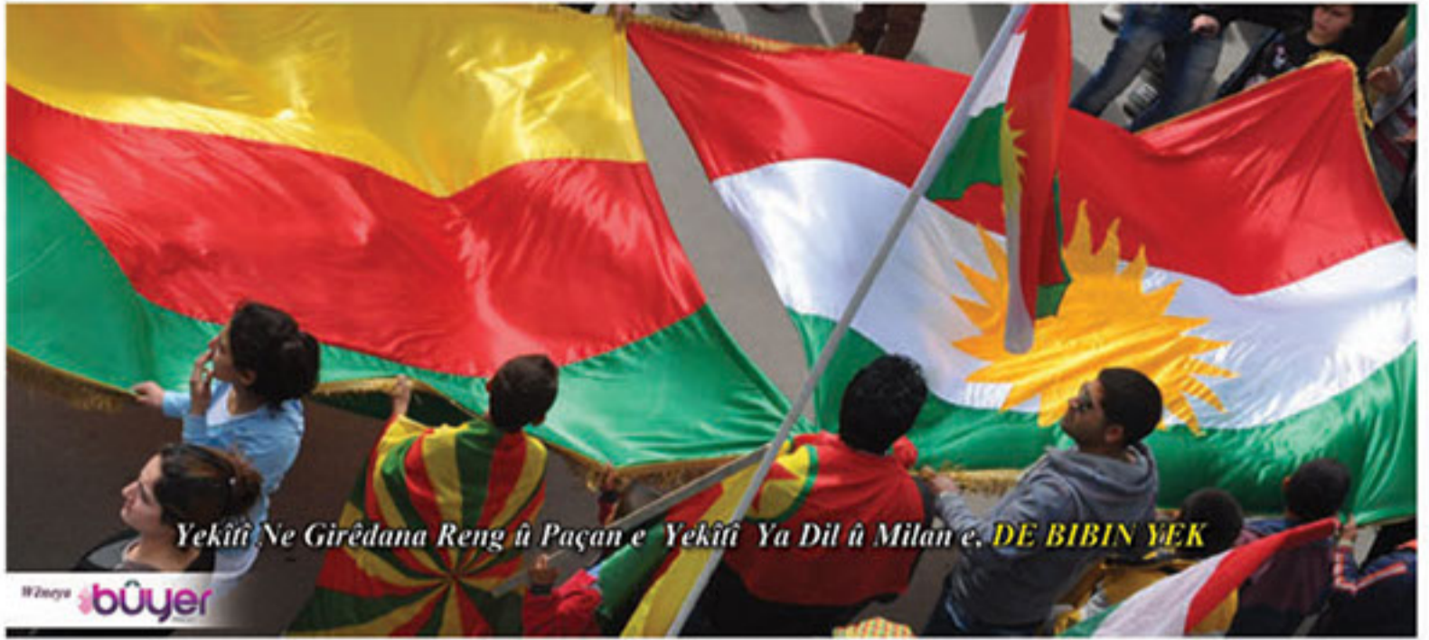
Yekîtî Ne Girêdana Reng û Paçan e Yekîtî Ya Dil û Milan e. DE BIBIN YEK