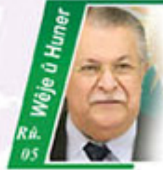
MAM Rû. 05 Wêje û Huper Anahîta Hemo