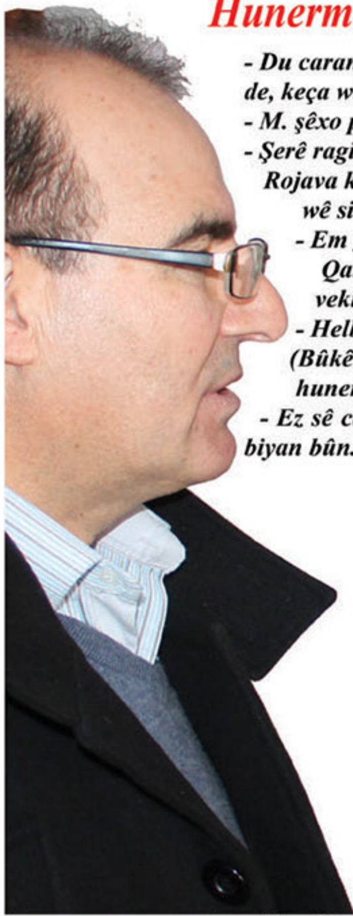
Hunermend Beha Şêxo çawa li koçkirina xelkê Rojava dinere?

- Ez sê caran daketim sûka Qamişlo, min tu riwên nasyar nedîtin, mixabin ... hemû biyan bûn.