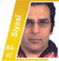
Siyasî Rû. 02 Nivîsandîn Di Bin Siya Diktatoran De Helim Yûsiv