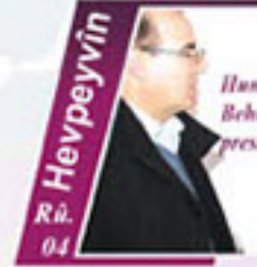
Heypeyvîn Rû. 04 Hacermendî Kurd Beha Şexo Ji Bûyer- press Re Di-axivê